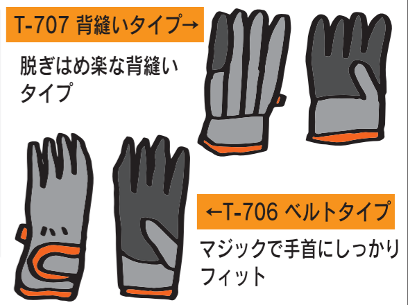
T-707 背縫いタイプ→ 脱ぎはめ楽な背縫い タイプ