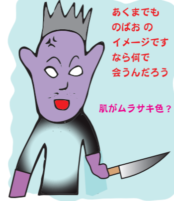
あくまでものぼおのイメージです なら何でも合うだろう 肌がムラサキ色？ 不良ってこういうのだけ？