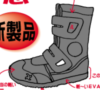
軽いナイロンオックス この部分の水加工 軽いEVAミッドソール ハイパーV S線相当の軽い 樹脂先芯