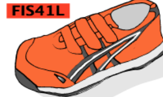
0990 オレンジ×ブラック

ば、成果はずいぶん違うと思います。ご参考にしてください。また本気で売ろうとしているお店さんは売り場からして違います。いくつかの他の安全靴と一緒にただ並んでいる訳ではありません。見るからに売れる売り場で