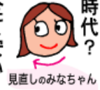
見直しのみなちゃん

なんでもかんでも安い時代？ 同じ様な商品なら安いモノを選ぶと思います。でも自分達の生活でも全て安いモノばかりを選んでいいのでしょうか？