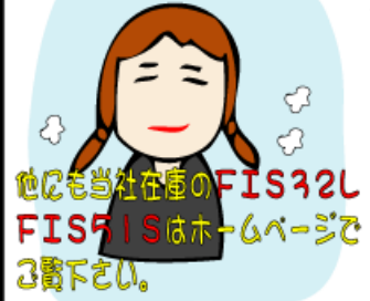
他にも当社在庫のFIS42L FIS51Sはホームページをご覧ください。

またホームページ上の紹介で、結構売られる所もあります。当社にはユーザーさんからのお問い合わせも結構ありますので、見本だけでも置いて下さると、ご紹介しやすいです。