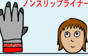
ノンスリップライナー