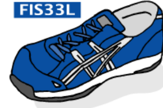
4393 ロイヤルブルー×シルバー