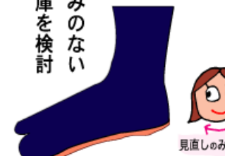
見直しのみなちゃん

でも高いですよ。青編は7枚、10枚、紺サージは10枚が在庫です。また、藍染めの手甲も売れます。4枚、5枚、6枚とあります。