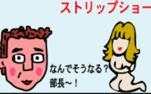
ストリップショー