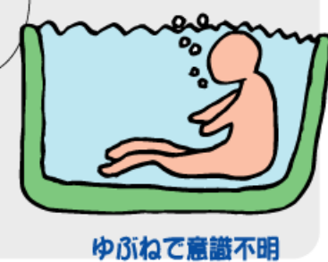
ゆぶねで意識不明

た瞬間に意識不明でバタンと倒れたり、お風呂に入った時ゆぶねに頭からつかってしまった、たまたま家族が心配で見に来てくれたからよかったもののそのままいたら死んでいたかもしれない出来事がたくさんありました。