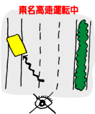
東名高速運転中 急に目の前が真っ白になりましたがのろのろ左には寄せられた様です

東名高速道路を運転中に、急に目の前が真っ白になって見えなくなったり、ある交差点では左折し