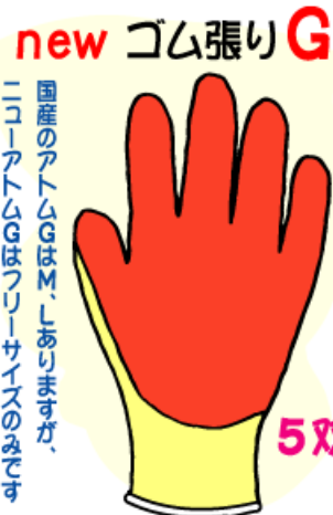
国産のアトムGはM、Lありますが、ニューアトムGはフリーサイズのみです。

値段はもちろん安くなります。ご発注の際、しばらくはタイ製がよろしい時は「ニューアトムG」と「ニュー」を付けて頂ける様、よろしくお願ひします。