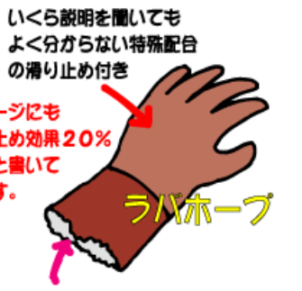
いくら説明を聞いてもよく分からない特殊配合の滑り止め付き

使う事になれていない我々にとっては何気ない事ですが、働く人から見ると、汚れた指先を使って履き口を触る事なく手にはめれる事は、かなり重要な要素の様です。