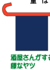
酒屋さんがする様なヤツ