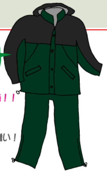
グリーン/ブラック